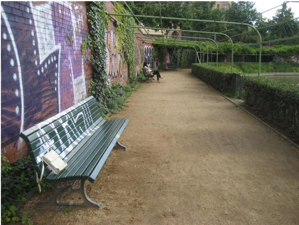
Vergessen: auf einer Parkbank am Engelbecken